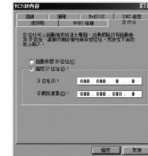
視窗98 / ME